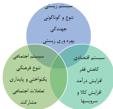
شکل ۱- رویکردهای توسعه پایدار (Jaarsma et al., ۲۰۰۷)

با عنایت به آنچه گذشت، «در رویکرد توسعه پایدار، تمام ابعاد توسعه شهری، روستایی و منطقه‌ای و ملی مدنظر است» (زیاری، ۱۳۷۸). برای این منظور «برنامه‌ریزی آرمانی و هدفمند در مناطق روستایی نیازمند رویکردی است که در آن فرایندهای پایدار با عوامل مکانی - فضایی در یک چارچوب مشخص ترکیب شوند. در این چارچوب، دولت‌ها و سازمان‌ها در مرکزیت قرار دارند. امروزه اکثر برنامه‌های کشورهای در حال توسعه، حول محور توسعه پایدار می‌باشد. بر این اساس برنامه‌ریزان در این جوامع از طریق الگوبرداری شیوه‌های کشورهای توسعه‌یافته می‌کوشند تا از طریق رویکردهای توسعه پایدار (شکل ۱)، حفظ و ارتقای محیط در سطوح ملی، منطقه‌ای و محلی را فراهم نمایند» (Jaarsma et al., ۲۰۰۷)